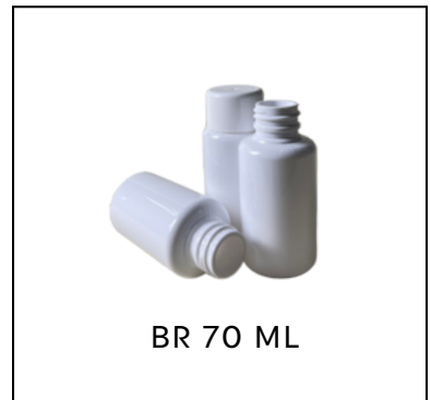
BR 70 ML