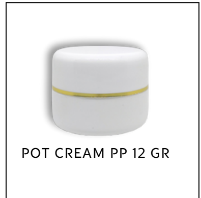
POT CREAM PP 12 GR