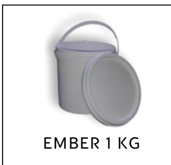
EMBER 1 KG